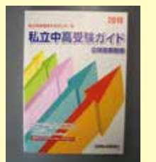
中学・高校進学情報説明会に参加した方にプレゼント

日時: 7月2日(日) 午前9:30~11:40 場所: 館林文化会館第3号室 費用: 塾生・保護者 無料 塾外生・保護者 1,000円(税込)